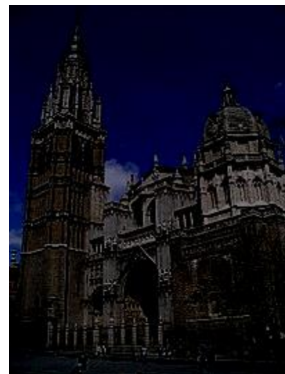
Katedra w Toledo w Hiszpanii